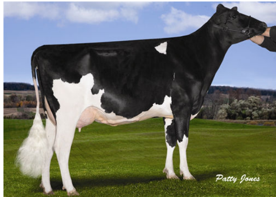
STANTONS FREDDIE CAMEO Granddam